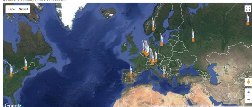
Locations of ready Pillars of Freedom

Info: http://www.pillars-of-freedom.com/index.php/de/